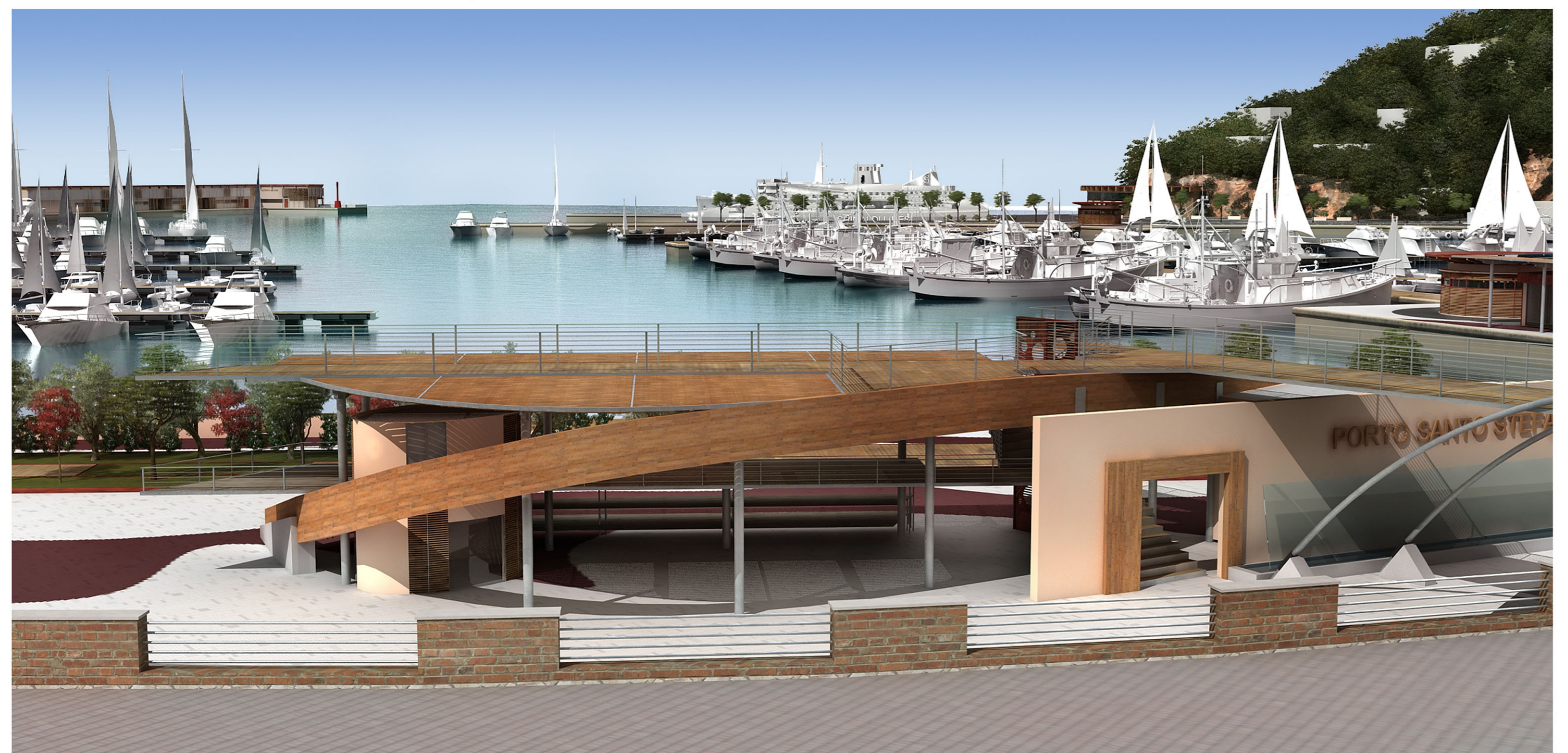
A SINISTRA: VISTA DI INSIEME DEGLI INTERVENTI DA VIA DELLA VITTORIA IN BASSO: VISTA DEL MOLO GARIBALDI E DI PIAZZALE CANDI